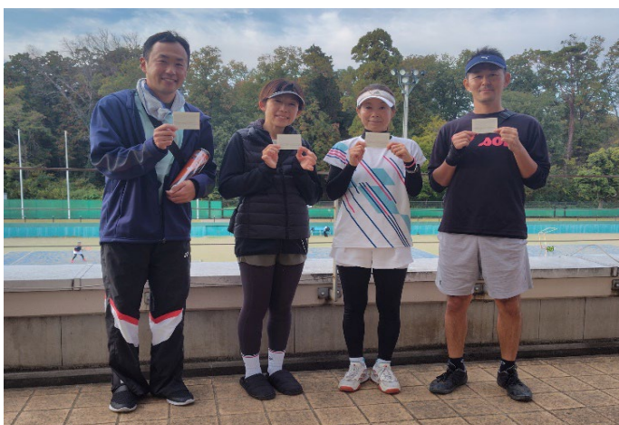
一般 準優勝 T3プラス