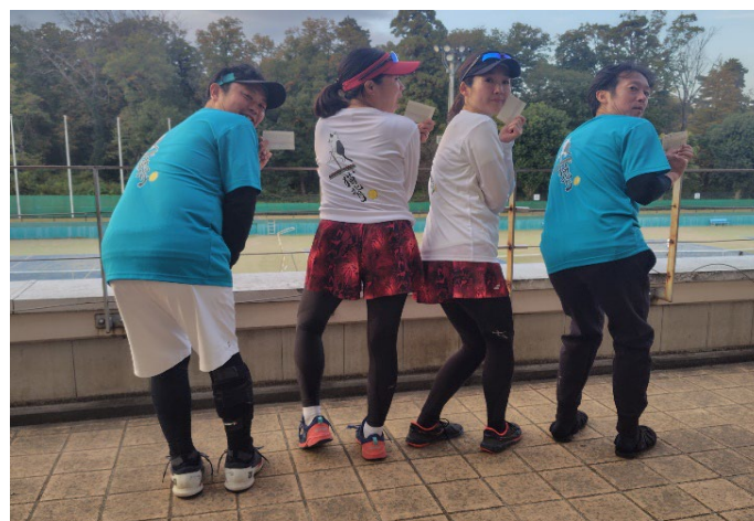
ベテラン 準優勝 PADDLE