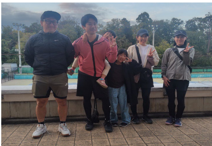
初中級 準優勝 ポーラベアーズ