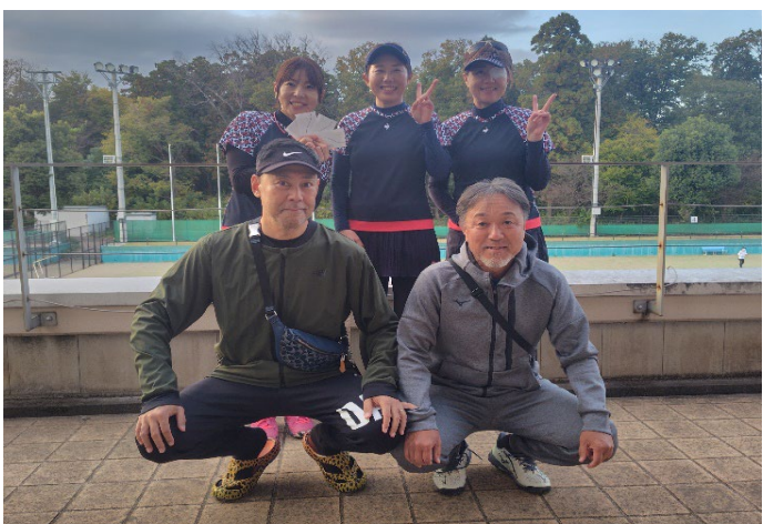
ベテラン 優勝 SMILE-UP