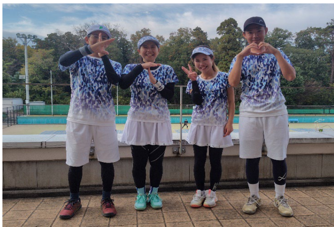
一般 優勝 KT3