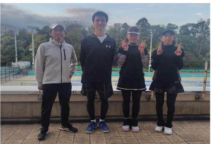
初中級 優勝 ブラックベアーズ